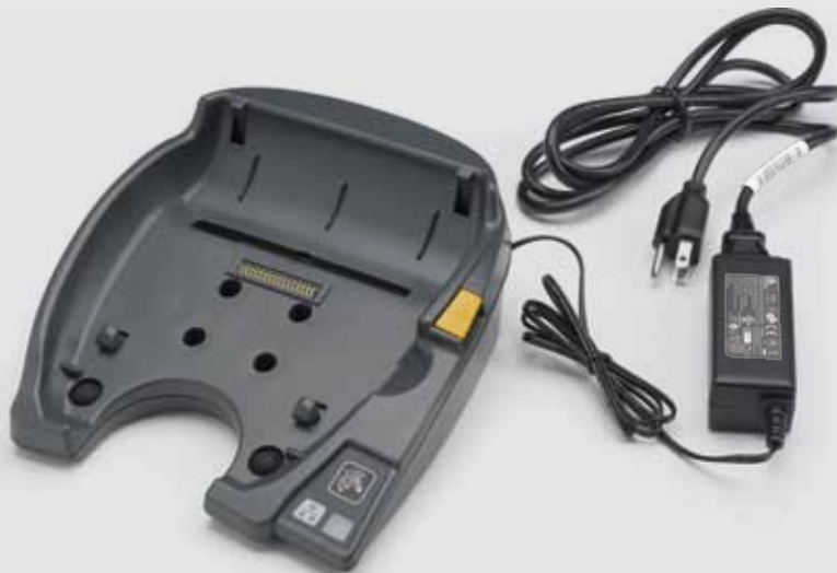
QLn420-Lade- und Ethernet-Docking-Station